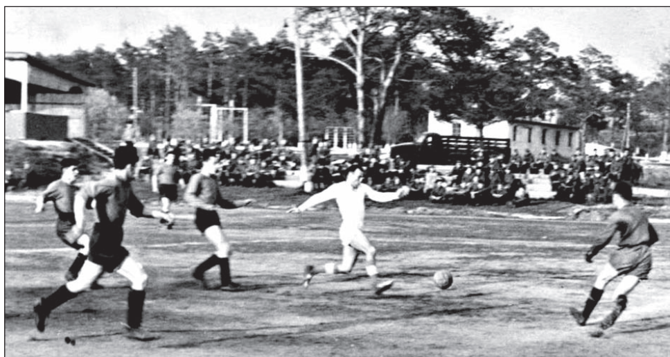
Так выглядел любительский футбол в 1950-х.

Футбол совмещали с работой. Матчи чемпионата