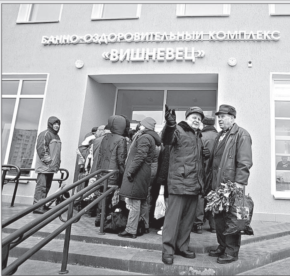
Первые посетители бани.

К слову, запланированную долю освоит ЖКХ. 65 миллиардов заложено на благоустройство. Распорядителем средств, выделенных на эти цели, выступит Гродненская городская центральная поликлиника. На жилищно-коммунальные услуги и жилищное строительство направят 285,9 миллиарда. Из них львищ