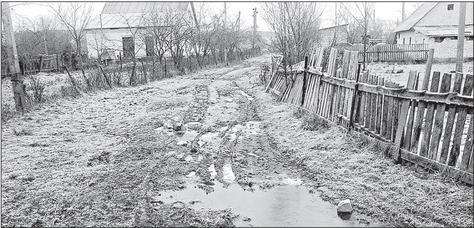
Фото сделано 2 декабря 2012 года

Добрый день! Я являюсь постоянной подписчицей газеты последние 5 лет. Думаю, нашему городу повезло. 14 февраля в Гродно состоится встреча в рамках Лиги Европы борисовского БАТЭ и турецкого «Фенербахче».