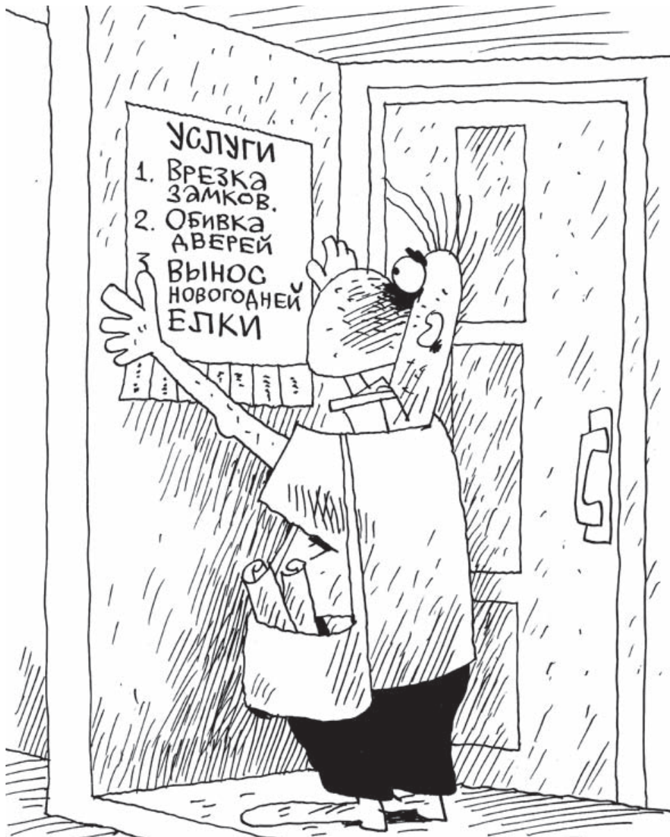
Рис. Петра Козича

Больше всего налогов за прошлый год принесли ОАО «Гродненская табачная фабрика «Неман», РУП «Гродненский ликеро-водочный завод «Немановф», РУП «Гродноэнерго», ПРУП «Гродноблгаз». Бюджет Гродненской области пополняют более 390 тысяч плательщиков, в том числе более 15,2 тысячи организаций, 27,1 тысячи индивидуальных предпринимателей и 348,1 тысячи физических лиц.