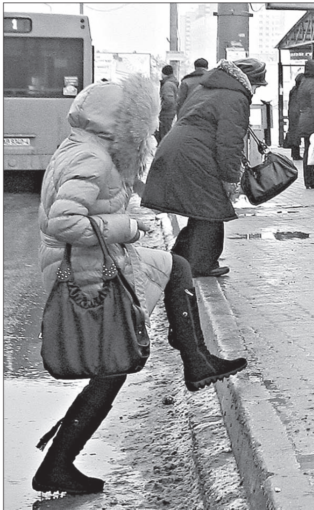
Бордюры на остановке возле универсама «Брест» стали очень высокими.

В каких случаях придется платить за лишнюю площадь? Почему одни платят, а другие нет, если квартиры одинаковые по площади и проживает там одинаковое число людей?