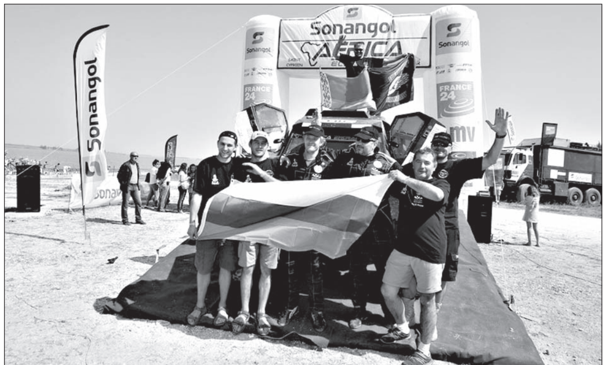
Вся команда на пьедестале!