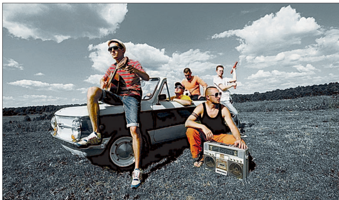
Группа «Без билета»