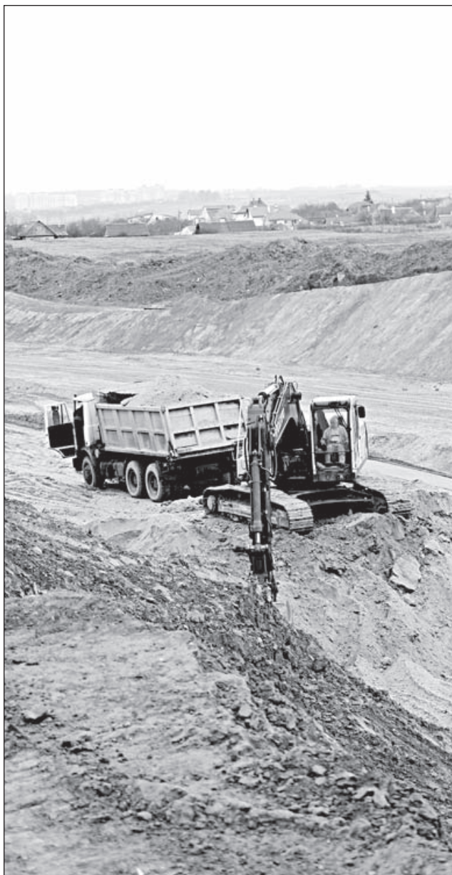
Собачью горку выравнивают для новой дороги.

пройдет по Собачьей горке, для чего ее уже сровняли до нужного уклона.