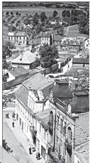
Первые годы после Великой Отечественной войны. Вокруг «кривого дома» (вверху снимка в центре) еще сохранилось несколько старых домов