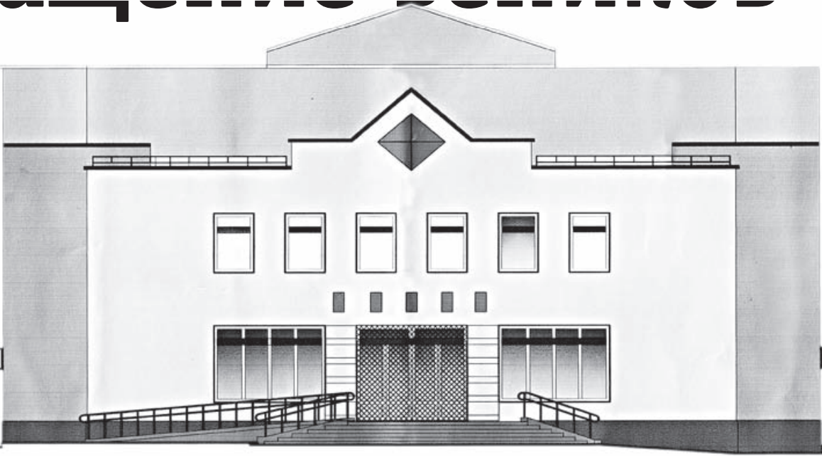
Фасад банно-оздоровительных комплексов в микрорайонах Девятовка и Вишневец

И все-таки прецедент вызвал дискуссию, какими дол-