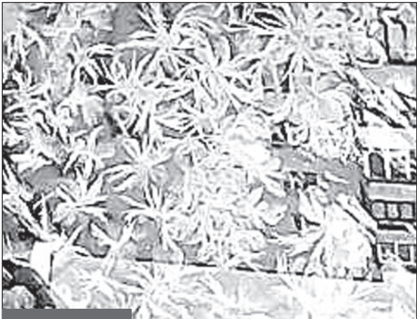
8.02 Мороз постарался на славу

Указывайте, что произошло, где и когда. Авторам опубликованных в газете снимков начисляется гоно-рар, который можно получить после 10 числа следующего месяца по адресу: ул. Социалистическая, 32, бухгалтерия.