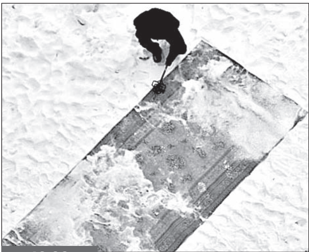
12.02 Воскресенье, 10 утра, под окнами