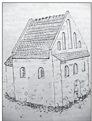
Верхняя церковь XIV–XV вв. Реконструкция

И все же этот храм уникален во всех отношениях — и как напоминание о своей неспокойной эпохе, и как памятник архитектуры. Может быть, его формы и не так притягивают к себе, как изящные стены Коложи или той же Нижней церкви, однако в грубой и на первый взгляд бессистемной кладке стен есть свои обаяние и тайна. Ведь перед нами старейшее из сохранившихся каменных