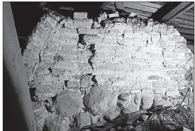
Остатки Верхней церкви. Современное состояние