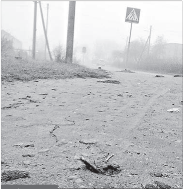
25.11 Металлический штырь около остановки в п. Южном. Ждем травм, чтобы его убрать?

Вы носите с собой мобильный телефон со встроенной фотокамерой? Фотографируйте то, что покажется интересным. Присылайте снимки с помощью MMS на редакционный мобильник +3752914141777. Указывайте, что произошло, где и когда. Авторам опубликованных в газете снимков начисляется гонорар, который можно получить после 10 числа следующего месяца по адресу: ул. Социалистическая, 32, бухгалтерия.