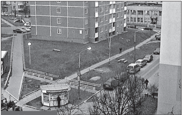
20.11 И это экономия электричества?