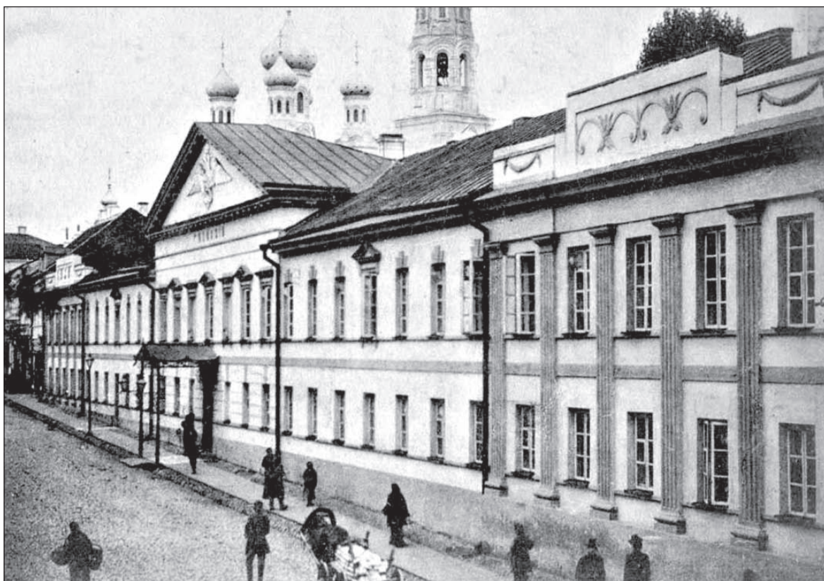
Гродненская гимназия на фоне православного собора - очень символическая композиция

А между тем когда-то гродненская гимназия была одной из богатейших школ Российской империи, с уникальной библиотекой, коллекцией минералов, нумизматики и даже собственной химической лабораторией! Ее история напрямую связана с деятельностью еще иезуитской коллегии, после закрытия преобразованной в окружную (позже — дворянскую) школу, которую передали в ведение отцам-доминиканцам. В здание